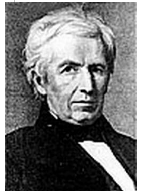
Marc François Seguin (1786 - 1875)