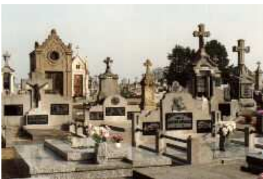
Liste établie d'après les relevés effectués par l'EGAN 92

Téléphone : 01 47 80 54 42 Courriel : egan92@club-internet.fr Site : http://genea92nord.free.fr